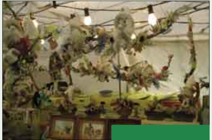
Hübsch dekoriert - die Stände des Zwiebelmarktes